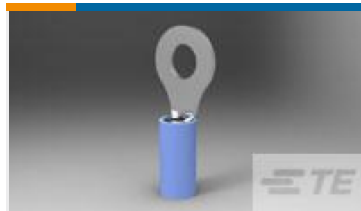
TE 产品编号31906 TERMINAL,PIDG R 16-14 1/4