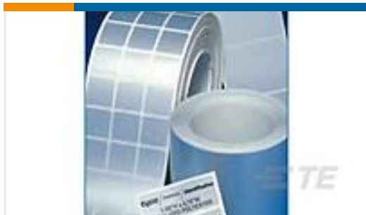
TE 产品编号C17298-000 WP-381064-10-9