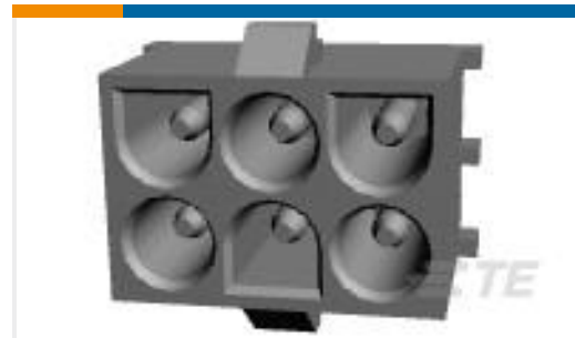
TE 产品编号350711-4 06P UMNL PIN HDR ASSY 94VO LF