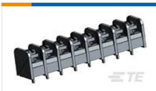
TE 产品编号4-1437664-1 NC6-P108-08=NC6 ASSEMBLY