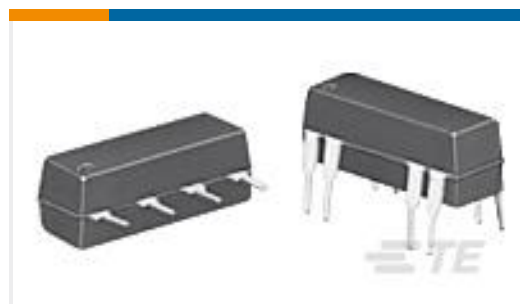
TE 产品编号1-1393771-6 JWD-171-24=REED RELAYS