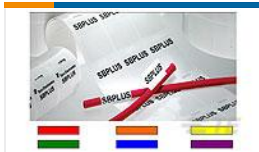
TE 产品编号CN2893-000 SBP050143WE10