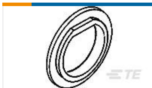
TE 产品编号330620 INSUL BUSHING BNC BLKHD PHEN