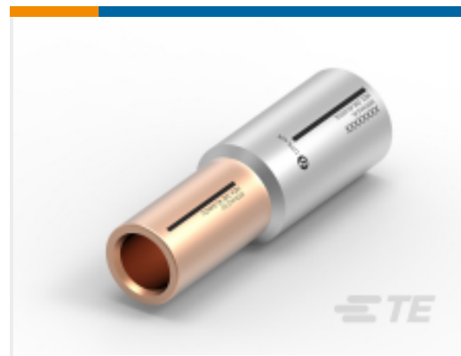
TE 产品编号CN1886-000 BK35-41/1