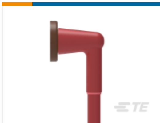
TE 产品编号718495-055 RSRB-4046