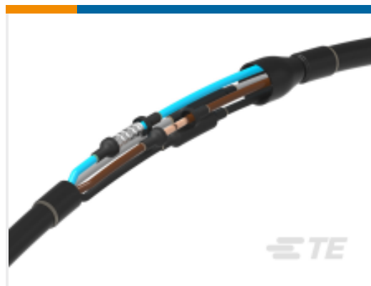
TE 产品编号464364-000 AFSJ-1C-BASIC