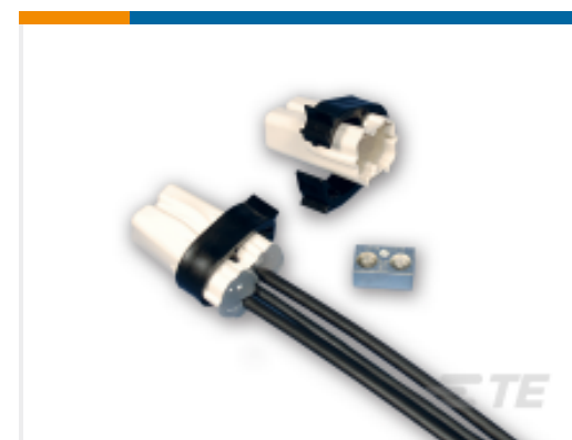
TE 产品编号 F40658-000 GELCAP-SL-2/0-3HOLE(B10)