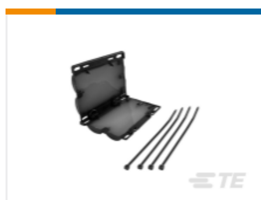
TE 产品编号 1710501-1 GELPACT-SMY