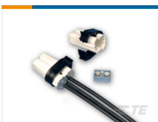
TE 产品编号 CP1967-000 GELCAP-SL-2/0-3HOLE-B100