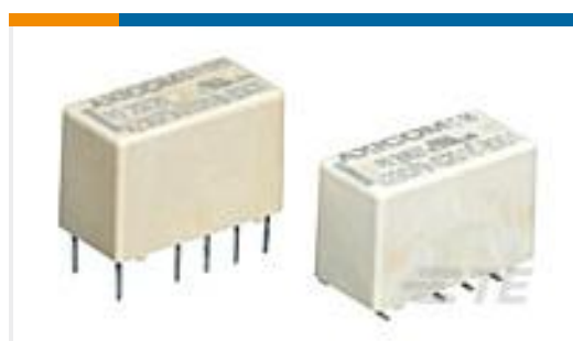
TE 产品编号5-1393788-8 V23079D1005B301