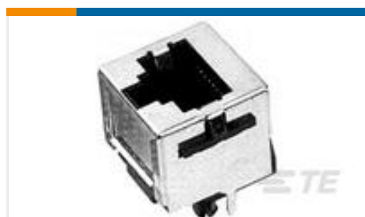
TE 产品编号1734577-1 MOD-JK,8P8C,SHD W/LED, G/Y,6U"