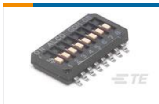
TE 产品编号1-1571983-1 GDH08STR04=DIP SWITCH