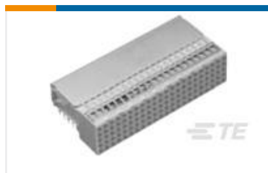
TE 产品编号352152-1 Z-PACK/B F-HDR 110P