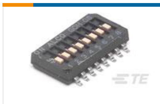
TE 产品编号1571983-1 GDH02S04=DIP SWITCH