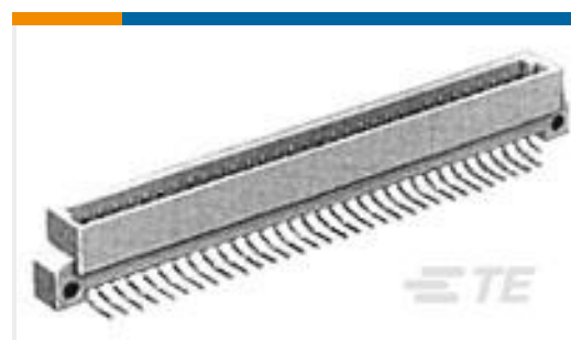
TE 产品编号536052-5 064 EURO TYPE B PIN ASSY