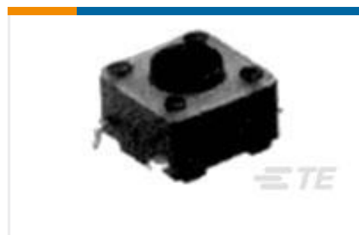
TE 产品编号1571563-9 FSM8JSMATR=TACT,SMT,T&R