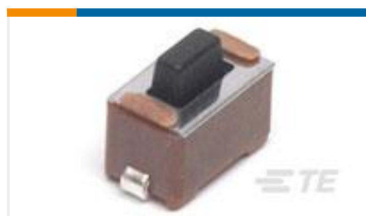
TE 产品编号1437566-3 FSM5M=3.5X6 SMT TACT