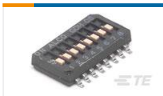
TE 产品编号1571983-8 GDH06S04=DIP SWITCH