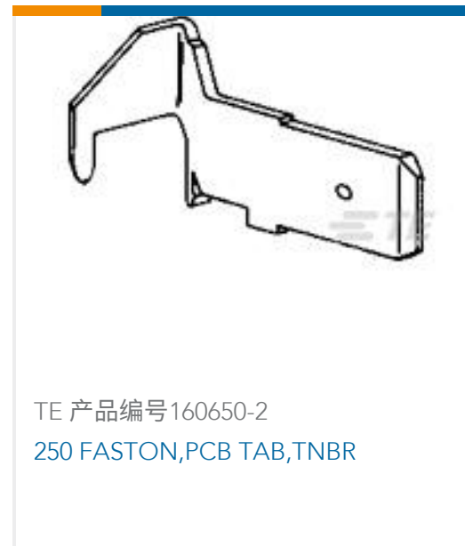
TE 产品编号160650-2 250 FASTON,PCB TAB,TNBR