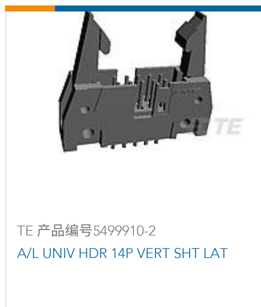
TE 产品编号5499910-2 A/L UNIV HDR 14P VERT SHT LAT