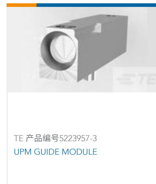
TE 产品编号5223957-3 UPM GUIDE MODULE