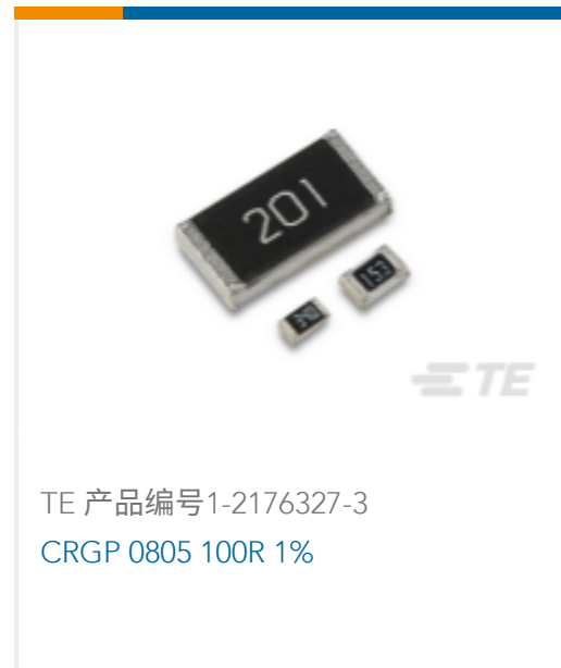
TE 产品编号1-2176327-3 CRGP 0805 100R 1%