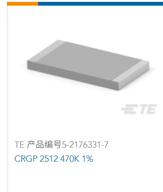
TE 产品编号5-2176331-7 CRGP 2512 470K 1%