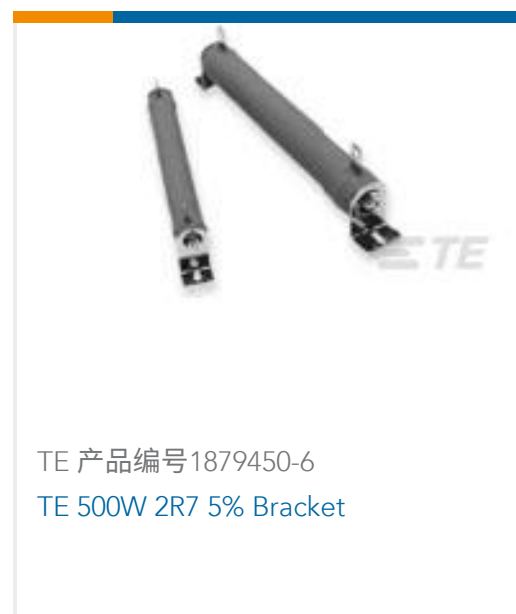
TE 产品编号1879450-6 TE 500W 2R7 5% Bracket