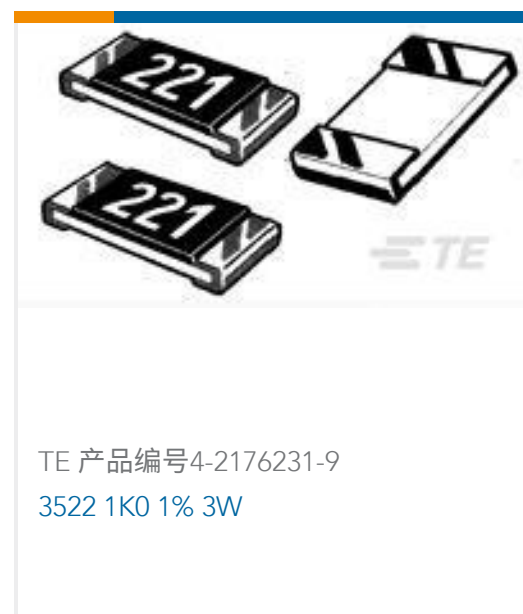
TE 产品编号4-2176231-9 3522 1K0 1% 3W