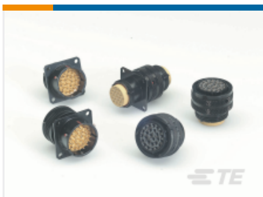
TE 产品编号ZPF00000000104408 FDBA 56-14-12 SN-K 081