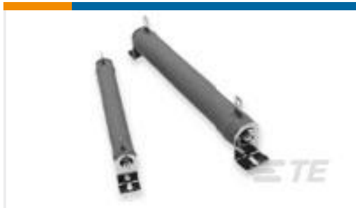
TE 产品编号1879444-4 TE 100W 1R8 5% Bracket