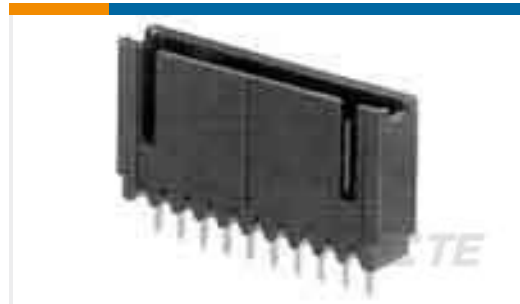
TE 产品编号5-103080-1 03 MODII HDR SRST SHRD .100CL