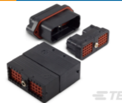
TE 产品编号DRC16-24SC DEUTSCH DRC Housings