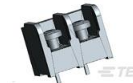
TE 产品编号5-1437657-7 8PCV-02-006=#8 TRIBARRIER TERM