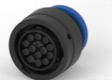
TE 产品编号YHDP26-18-14SECL20 PLG, 14P, BLK, E, KEY, RNG, 16, S