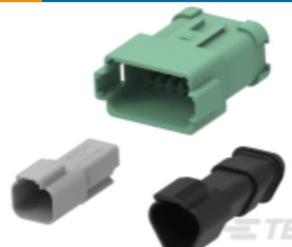
TE 产品编号DT04-12PA-E005 DEUTSCH DT Receptacle Connectors