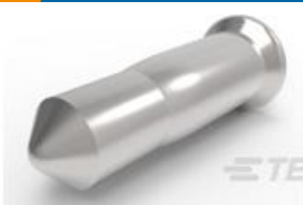
TE 产品编号 5645980-2 MSS ASSY SERIES 5 1/2 LP