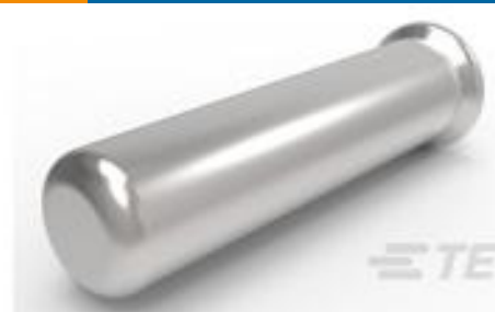
TE 产品编号5380598-2 RCR AU-SPR SN-CUP 018-040