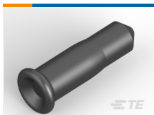
TE 产品编号 1-5645956-1 SOCKET,MIN-SPR B-N SN-SN SER-2