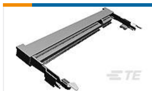
TE 产品编号1565917-4 EMBOSS ASSY DDR2 SODIMM SOCKET 200P 5.2H