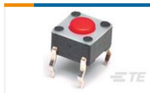
TE 产品编号1825910-6 FSM4JH=6MM TACT SWITCH, HIGH TEMP