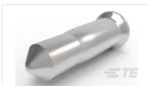
TE 产品编号 5645952-2 SOCKET,MIN-SPR B-N SN-AU SER-2.5