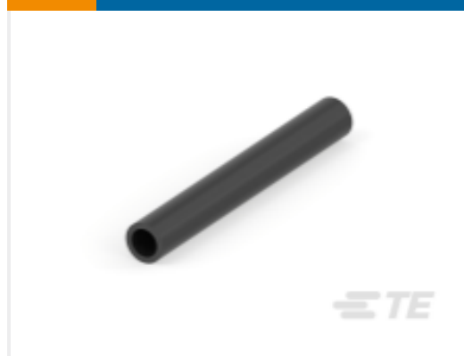
TE 产品编号CH03446001 QSZH 热缩管