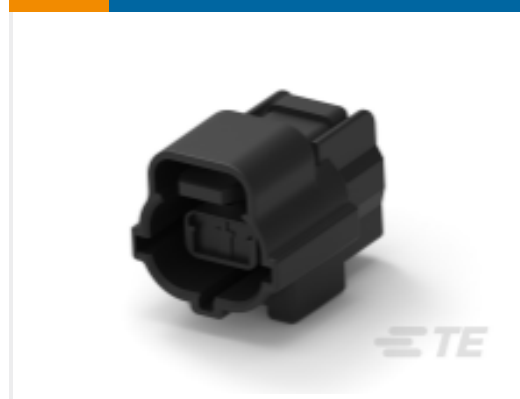
TE 产品编号2338360-1 2P ECONOSEAL RECEPTACLE ASSY