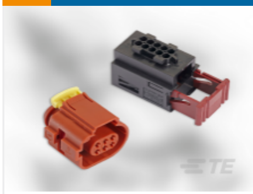
TE 产品编号1-967622-5 Timer Connector Housing