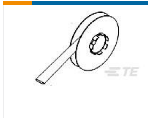
TE 产品编号946593-000 TTMS-4.8-9