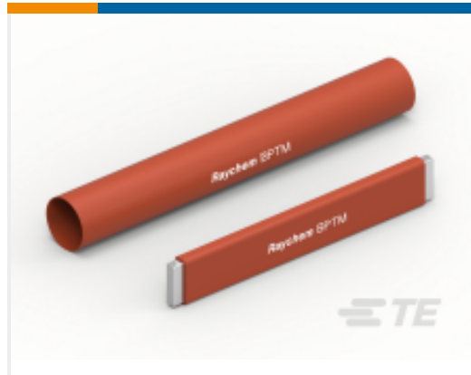
TE 产品编号398451-000 BPTM-75/30-A/U-4(S20)