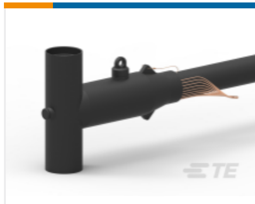
TE 产品编号ED9154-000 ELB-35-610G10-CES1