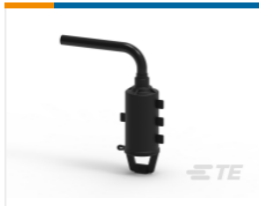
TE 产品编号1-708052-1 KZEP 4/0