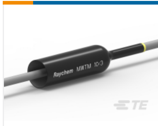
TE 产品编号069816-000 MWTM-10/3-1000/S(S25)