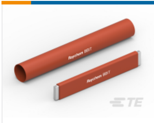
TE 产品编号560931-000 BBIT-40/16-A/U-4(S20)