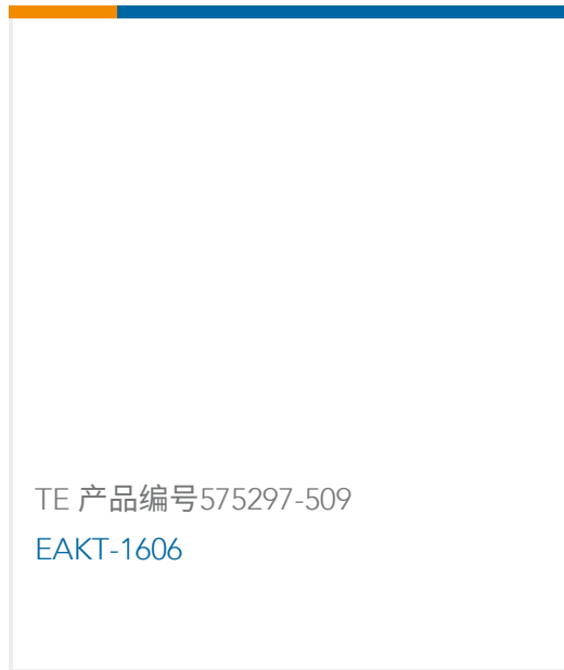
TE 产品编号575297-509 EAKT-1606