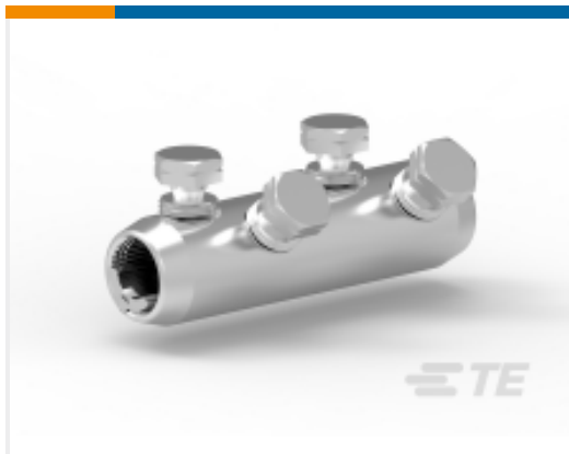
TE 产品编号C26220N001 BSMB-95/240-34