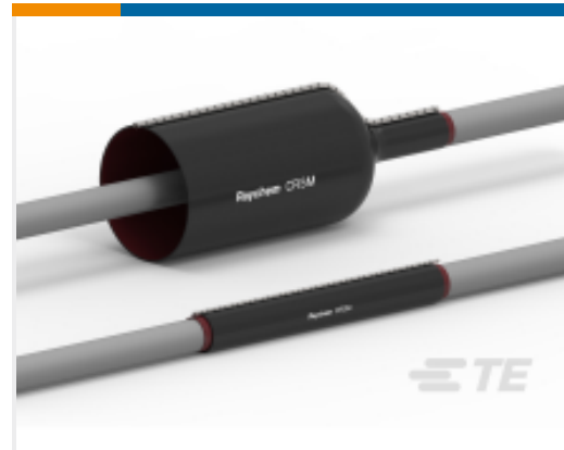
TE 产品编号445185-000 CRSM-34/10-1500/239(S1)