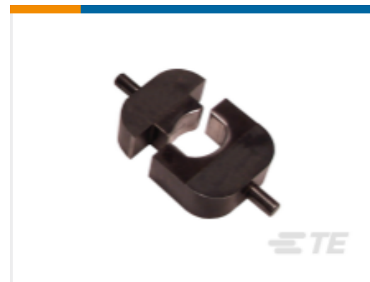
TE 产品编号 314948-1 HYP8/10 COPALUM SEALED 4/0AWG DIE SET