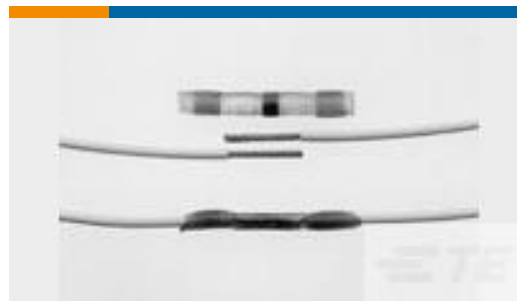
TE 产品编号D33598-000 B-152-9003