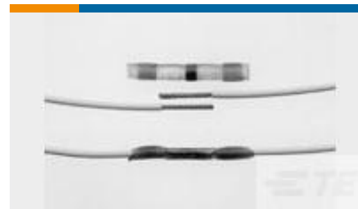
TE 产品编号F80600-000 B-152-9004