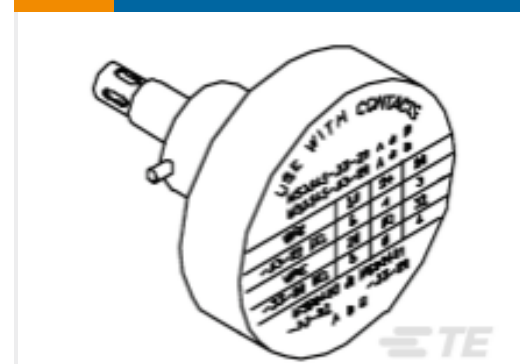
TE 产品编号2-2823582-1 POSITIONER M12 RAIL X-CODE SOCK COMPACT