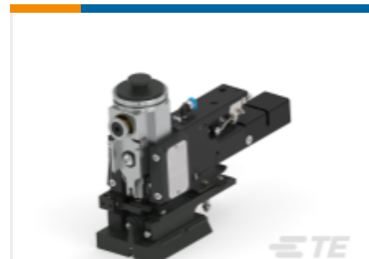
TE 产品编号2150631-1 OCEAN_2.0_APPLICATOR-E-100F- REM