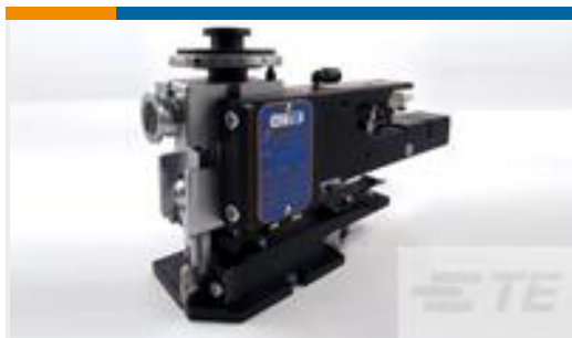
TE 产品编号2150283-2 OCEAN_2.0_Applicator-E-080F130F- REA