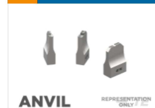
TE 产品编号2-1803293-3 ANVIL, COMBINATION DEUTCH STYLE