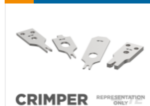
TE 产品编号2-1803019-9 CRIMPER, INSULATION O