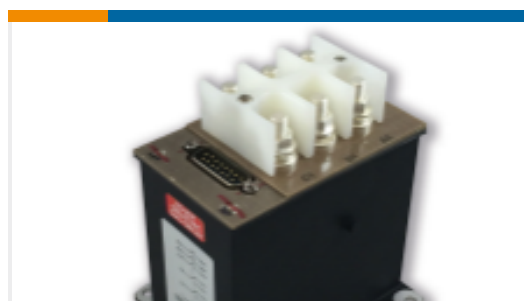
TE 产品编号1616004-5 AC Contactors: TPST