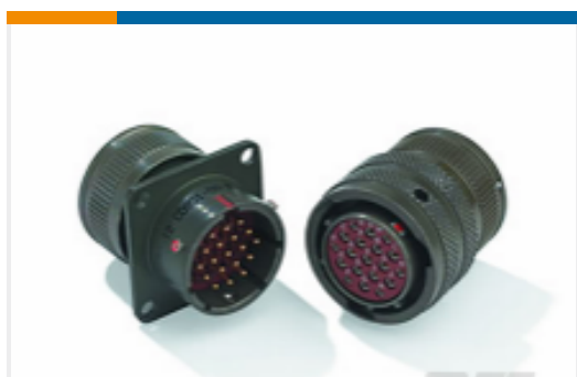
TE 产品编号ZPF000000000006768 951-06 RC 20-39 S 50