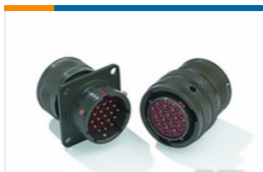
TE 产品编号ZPF000000000006697 951-06 RC 10-6 P 50