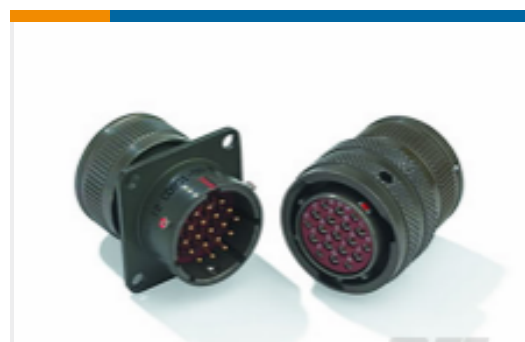
TE 产品编号ZPF000000000006198 951-00 RC 8-3A-P 50