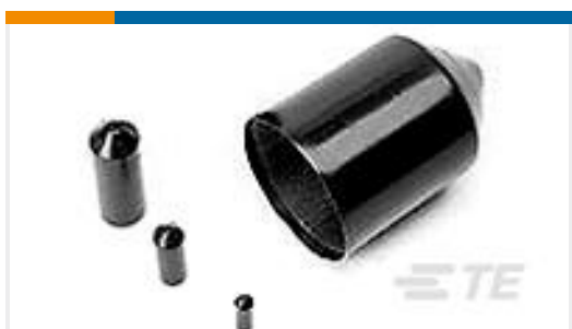
TE 产品编号843039-000 101A021-3-0