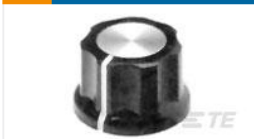
TE 产品编号5-1437624-3 PKES90B1/4=KNOB PLSTC FLUTED W