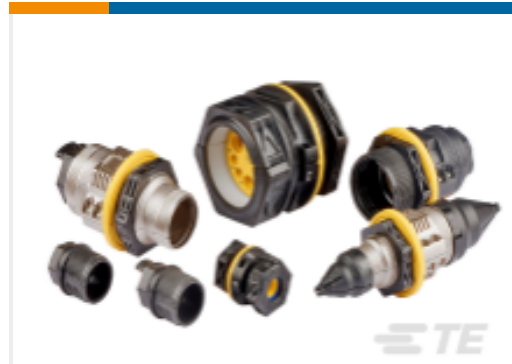
TE 产品编号ZPF000000000137412 D-EASY 03 B 05