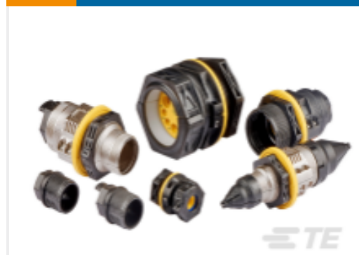
TE 产品编号ZPF000000000099320 D-EASY 03 B 02