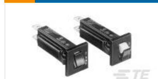
TE 产品编号2-1393250-6 W28-XQ1A-11=W28