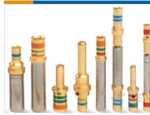
TE 产品编号0641-3-1231L CONT PIN