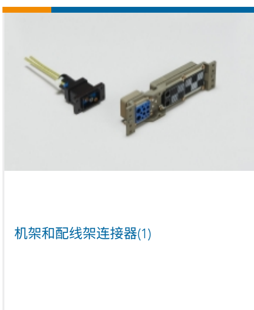
机架和配线架连接器(1)