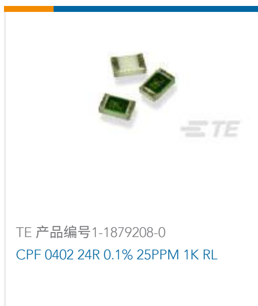
TE 产品编号1-1879208-0 CPF 0402 24R 0.1% 25PPM 1K RL