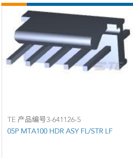
TE 产品编号3-641126-5 OSP MTA100 HDR ASY FL/STR LF