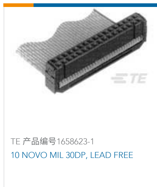
TE 产品编号1658623-1 10 NOVO MIL 30DP, LEAD FREE