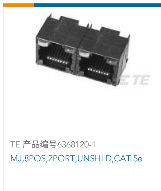
TE 产品编号6368120-1 MJ,8POS,2PORT,UNSHLD,CAT 5e