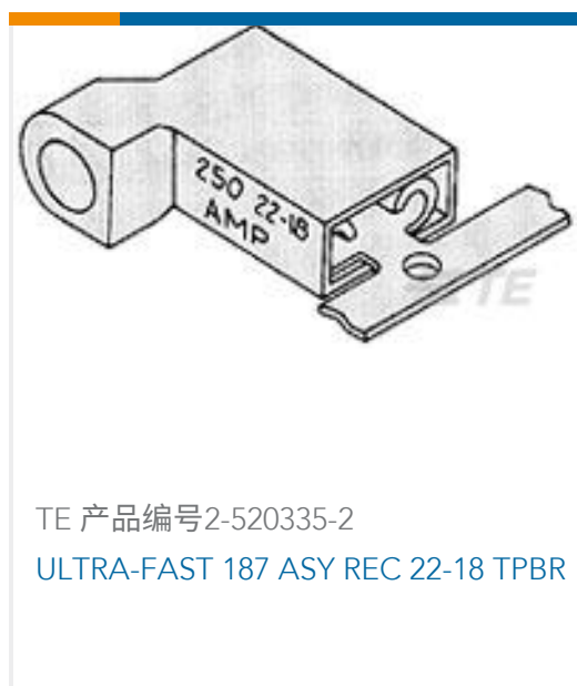
TE 产品编号2-520335-2 ULTRA-FAST 187 ASY REC 22-18 TPBR