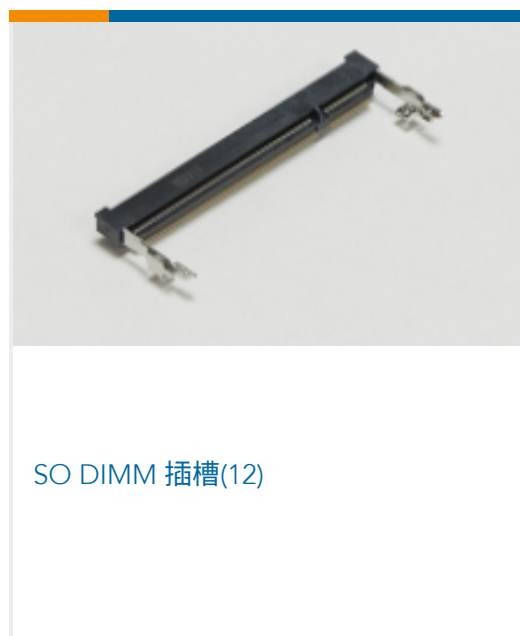
SO DIMM 插槽(12)