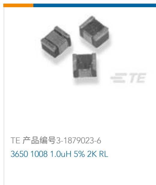
TE 产品编号3-1879023-6 3650 1008 1.0uH 5% 2K RL