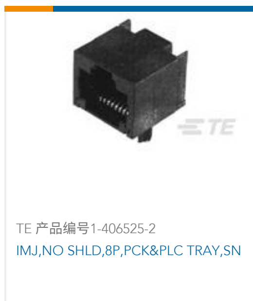
TE 产品编号1-406525-2 IMJ,NO SHLD,8P,PCK&PLC TRAY,SN