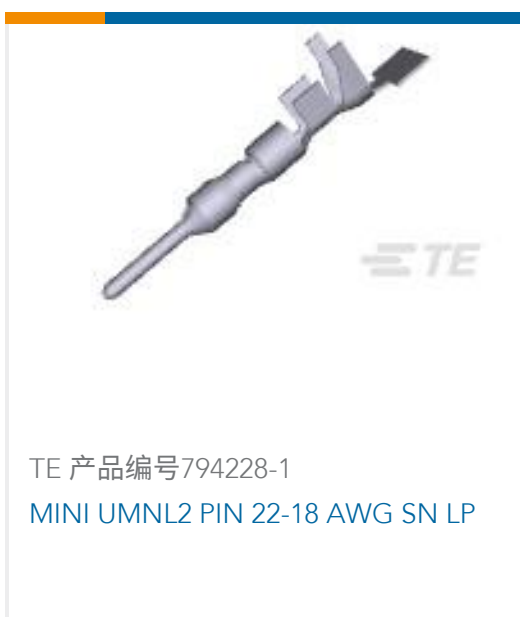
TE 产品编号794228-1 MINI UMN2 PIN 22-18 AWG SN LP