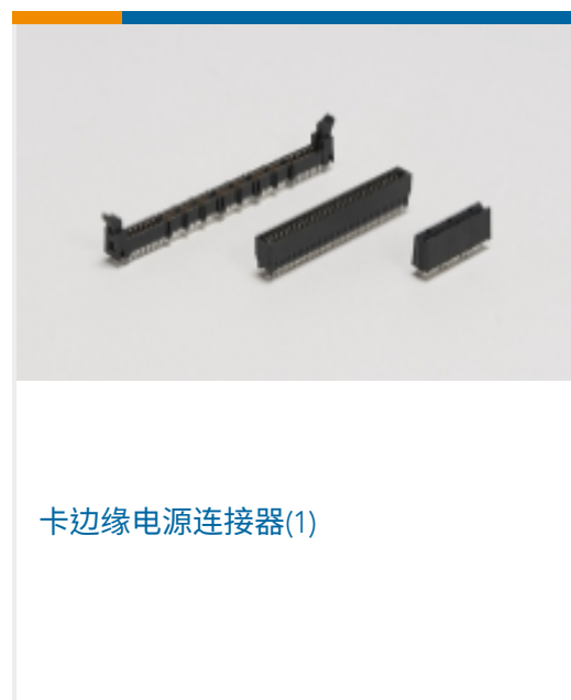
卡边缘电源连接器(1)