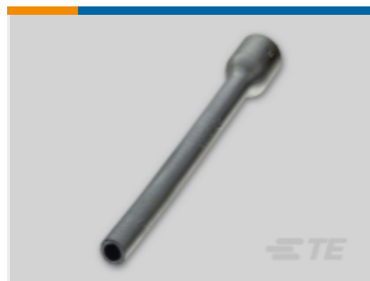
TE 产品编号814266-000 小尺寸热缩护套：聚合物成型，有嘴，直形