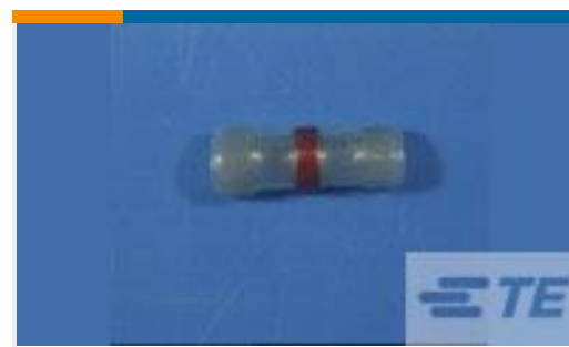
TE 产品编号620080N004 D-108-12CS948