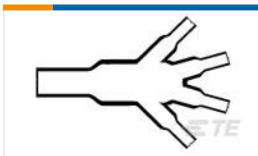
TE 产品编号571833-000 562A054-25/86-0