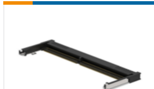
TE 产品编号2309411-4 DDR4 SO DIMM Sockets