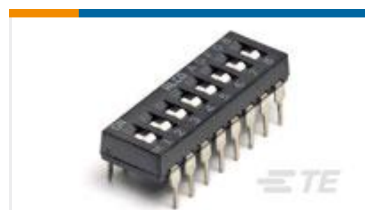
TE 产品编号6-1825059-1 ADF03STR04=DIP S,FLUSH,SMT-GW, NO SEAL