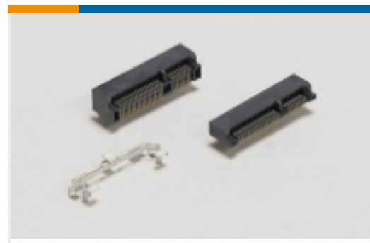
Mini PCI Express 和 mSATA(1)