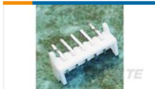
TE 产品编号440053-7 2.5MM,HDR,7POS,R/A