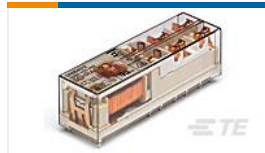
TE 产品编号3-1415019-1 SR6C4060 - V23050-A1060-A551