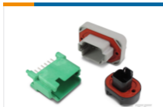
TE 产品编号DT13-12PB DEUTSCH DT Headers