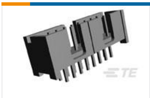
TE 产品编号103308-1 010 LOPRO HDR SP 15DP