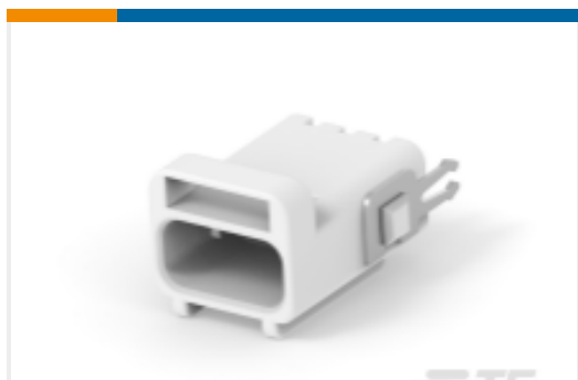
TE 产品编号1-2834237-2 2P REC, IP67 VERTICAL T/H CONN, NATURE