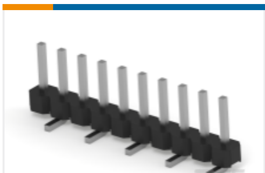
TE 产品编号1-2842102-0 10P,2MM,BRK HDR,SRVT,SMD,0.1AU, TR W/CAP