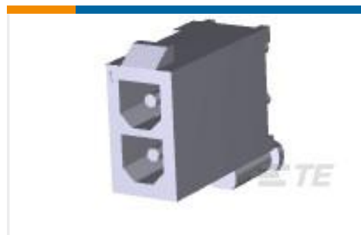
TE 产品编号1-770872-0 02P MINI UMNL HDR ASSY SN