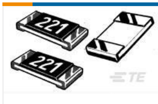
TE 产品编号3-2176231-2 3522 200R 1% 3W