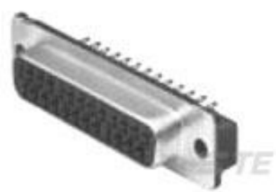
TE 产品编号5747090-2 09 RCPT ACT PIN/MS MED INSRT