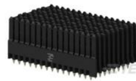
TE 产品编号1410135-1 MULTIGIG RT T2 .8" BP FULL CNT