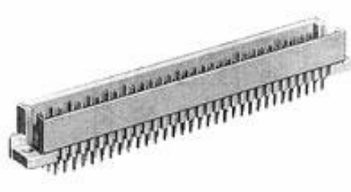
TE 产品编号536019-5 096 EURO TYP R PIN AP MFBL ASY