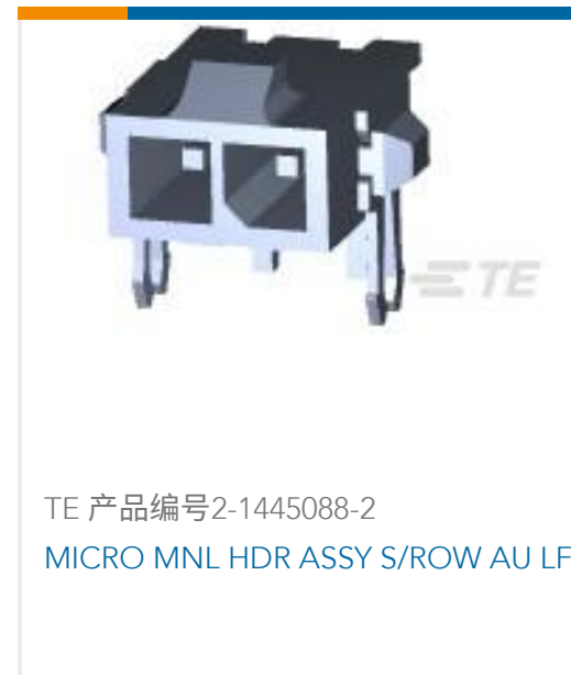
TE 产品编号2-1445088-2 MICRO MNL HDR ASSY S/ROW AU LF