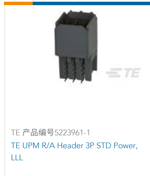
TE 产品编号5223961-1 TE UPM R/A Header 3P STD Power, LLL