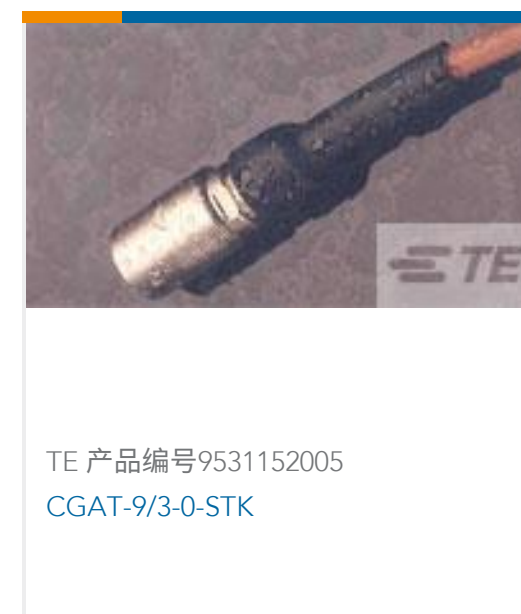
TE 产品编号9531152005 CGAT-9/3-0-STK