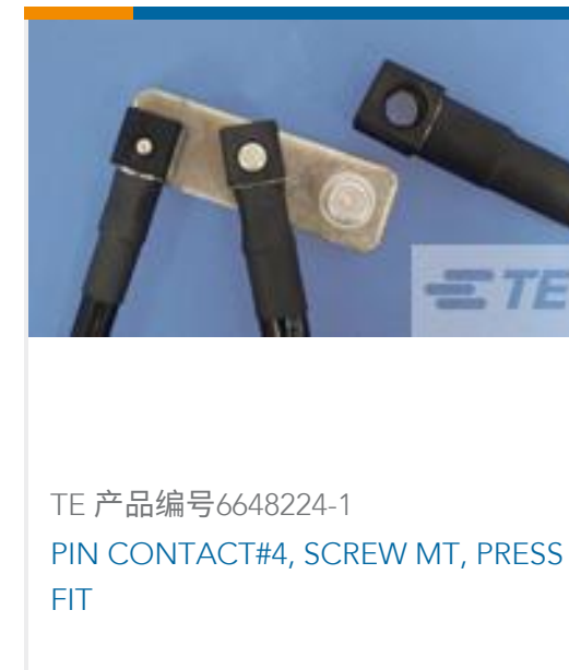
TE 产品编号6648224-1 PIN CONTACT#4, SCREW MT, PRESS FIT