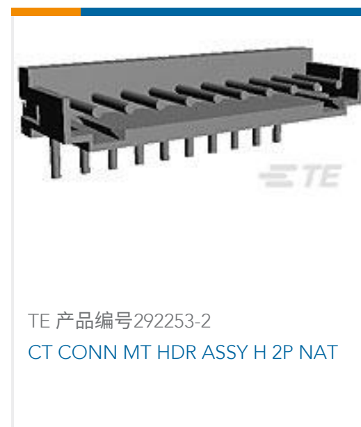
TE 产品编号292253-2 CT CONN MT HDR ASSY H 2P NAT