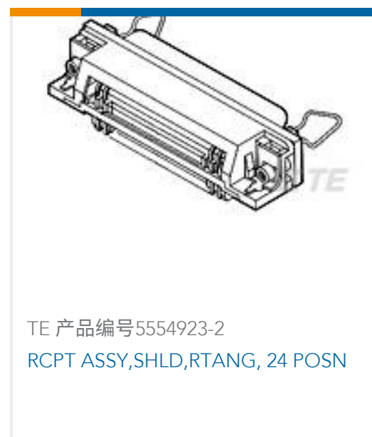
TE 产品编号5554923-2 RCPT ASSY,SHLD,RTANG, 24 POSN