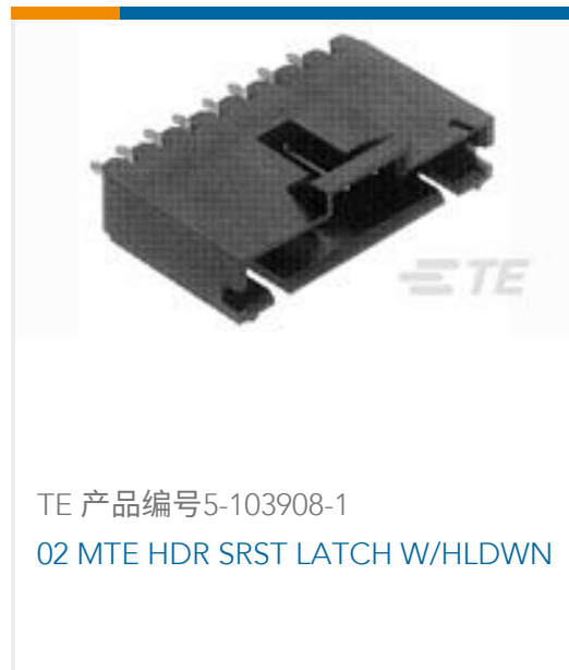
TE 产品编号5-103908-1 02 MTE HDR SRST LATCH W/HLDWN