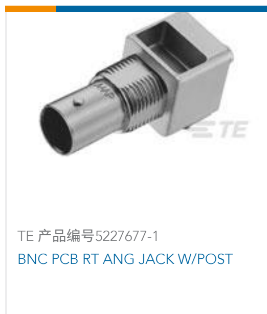
TE 产品编号5227677-1 BNC PCB RT ANG JACK W/POST