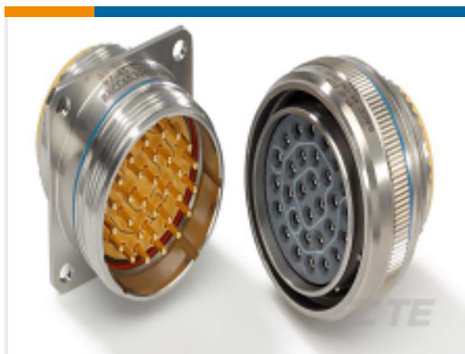
TE 产品编号 ZPF000000000007374 983-0S 14-15 PN