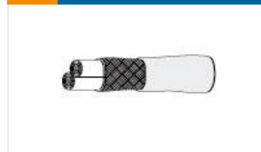
TE 产品编号 323763-000 55A1821-24-9/96-9CS2275