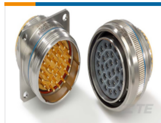
TE 产品编号 ZPF000000000007441 983-0S 22-55 PN