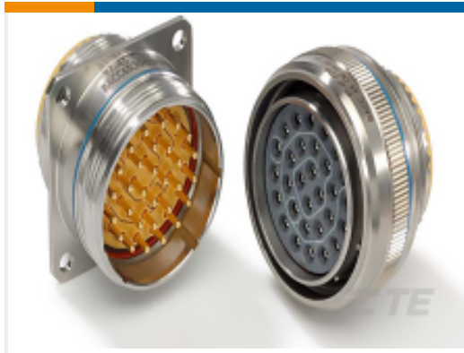
TE 产品编号 ZPF000000000007332 983-0S 10-06 P6