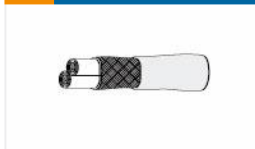
TE 产品编号 353785-000 55A1121-24-9/96-9CS2275