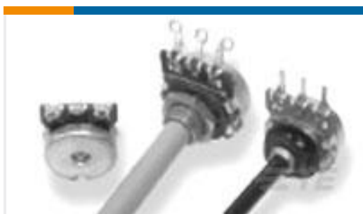
TE 产品编号1624213-2 23SE 10KB 6.35X50FL B7 CAT