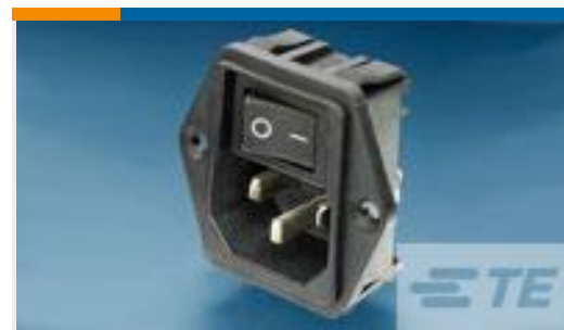
TE 产品编号1-1609112-2 15CE1=F8272