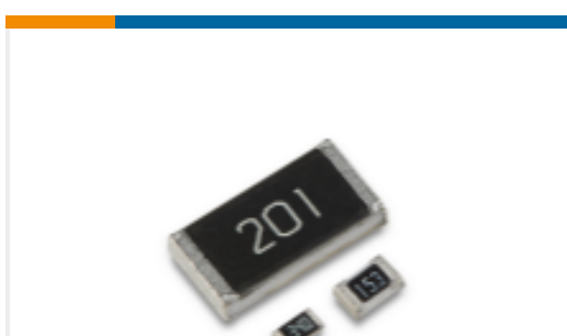
TE 产品编号1-2176329-3 CRGP 1210 100R 1%