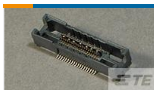
TE 产品编号2-767004-2 MICT,RECPT,038,ASSY,.025,REC