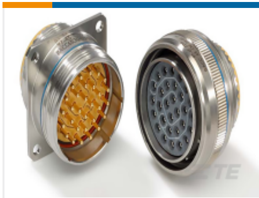
TE 产品编号ZPF000000000008202 983-6KE 10-05 SN