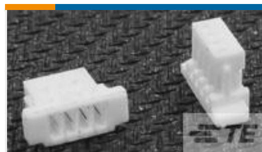
TE 产品编号1470364-8 1.0MM W T B RECPT,8POS HOUSING