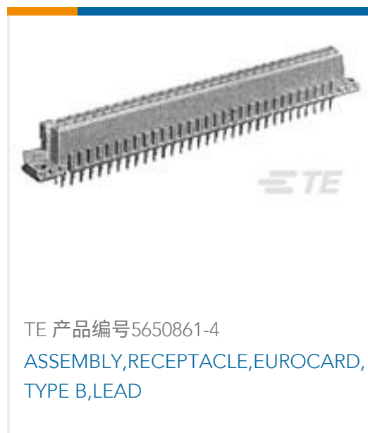
TE 产品编号5650861-4 ASSEMBLY,RECEPTACLE,EUROCARD, TYPE B,LEAD