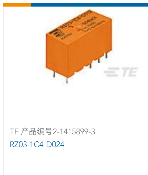
TE 产品编号2-1415899-3 RZ03-1C4-D024