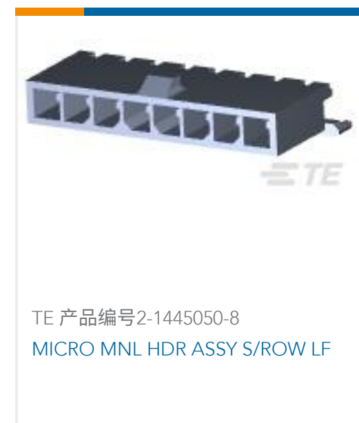
TE 产品编号2-1445050-8 MICRO MNL HDR ASSY S/ROW LF