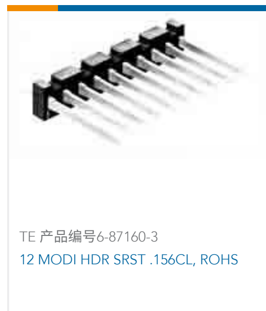
TE 产品编号6-87160-3 12 MODI HDR SRST .156CL, ROHS