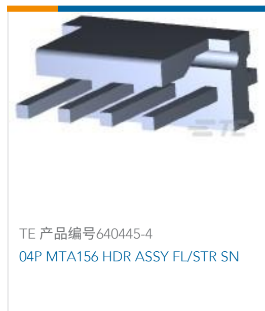
TE 产品编号640445-4 04P MTA156 HDR ASSY FL/STR SN