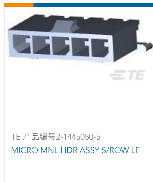
TE 产品编号2-1445050-5 MICRO MNL HDR ASSY S/ROW LF