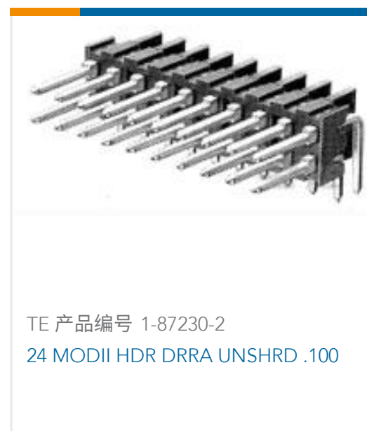
TE 产品编号 1-87230-2 24 MODII HDR DRRA UNSHRD .100