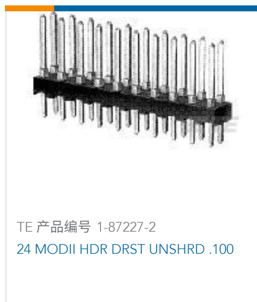
TE 产品编号 1-87227-2 24 MODII HDR DRST UNSHRD .100