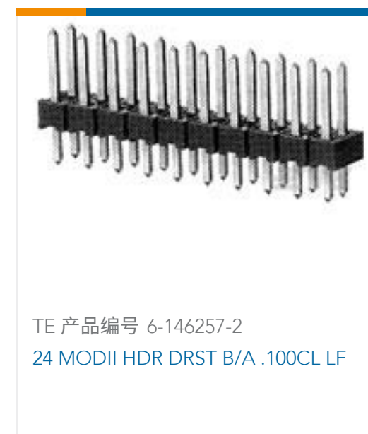
TE 产品编号 6-146257-2 24 MODII HDR DRST B/A .100CL LF