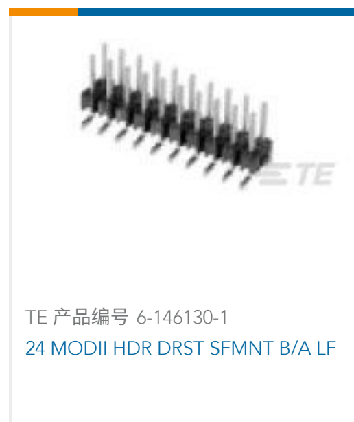
TE 产品编号 6-146130-1 24 MODII HDR DRST SFMNT B/A LF