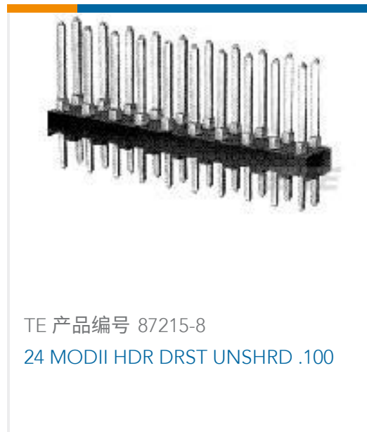
TE 产品编号 87215-8 24 MODII HDR DRST UNSHRD .100