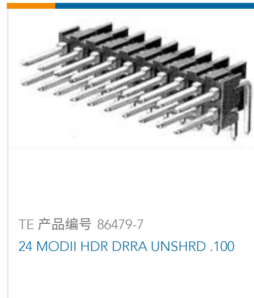
TE 产品编号 86479-7 24 MODII HDR DRRA UNSHRD .100