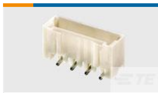
TE 产品编号5-292230-4 1.5 MINI CT SGL V SMT W/BOSS 4