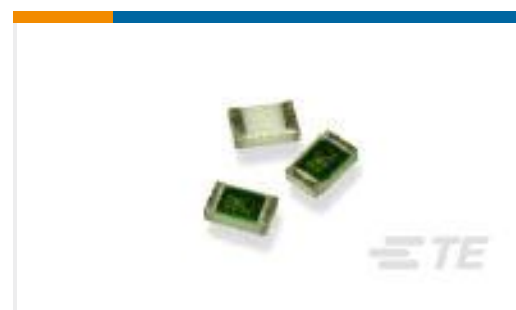
TE 产品编号1-1879338-3 CPF 0603 35K7 1% 50PPM 1K RL