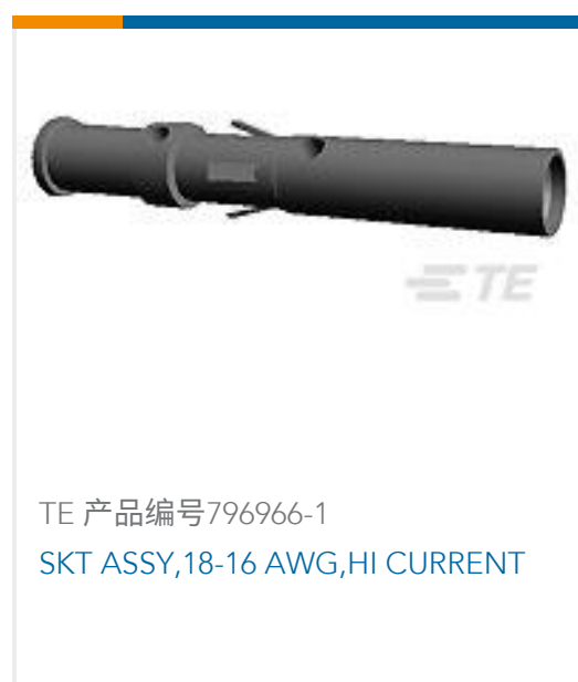
TE 产品编号796966-1 SKT ASSY,18-16 AWG,HI CURRENT