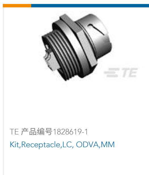
TE 产品编号1828619-1 Kit,Receptacle,LC, ODVA,MM