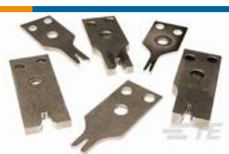
TE 产品编号1-456403-6 CRIMPER WIRE .062 F