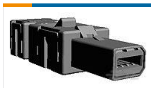
TE 产品编号2013595-1 INDUSTRIAL MINI I/O PLUG KIT D1