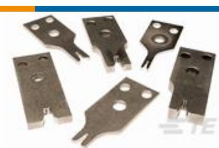
TE 产品编号1-456404-6 CRIMPER WIRE .070 F