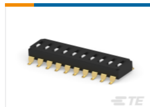
TE 产品编号3-2319848-1 END STACK DIP 10P G RECESS SEAL TUBE