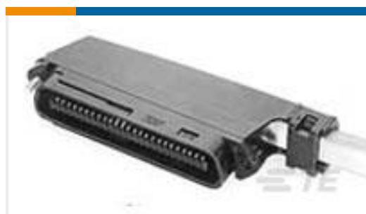
TE 产品编号5229912-1 KIT, PLUG, 50 POS, B SLOT C/LOK