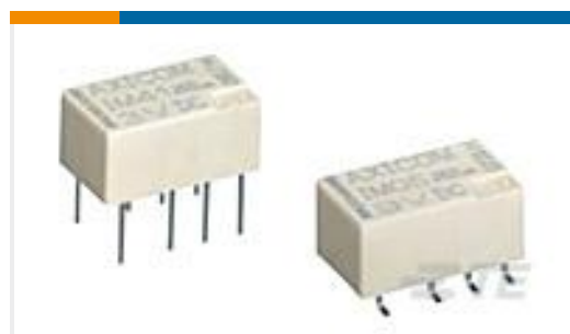
TE 产品编号3-1462037-1 IM42GR =IM RELAY 100mW 4.5V BIS