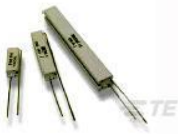
TE 产品编号1623722-4 SBCH 11 33R 5%