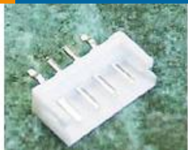
TE 产品编号1775284-3 HPI, 2.5MM, EMIX, A'SSY, V/T, 3P, IVORY