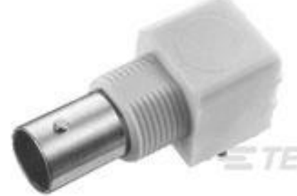
TE 产品编号5415633-1 RTANG BNC PCB JACK - 75 OHM