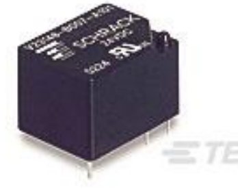
TE 产品编号2-1393203-8 V23148-A1007-A101