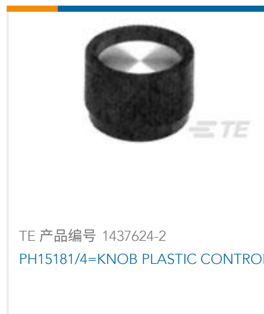
TE 产品编号 1437624-2 PH15181/4=KNOB PLASTIC CONTROL