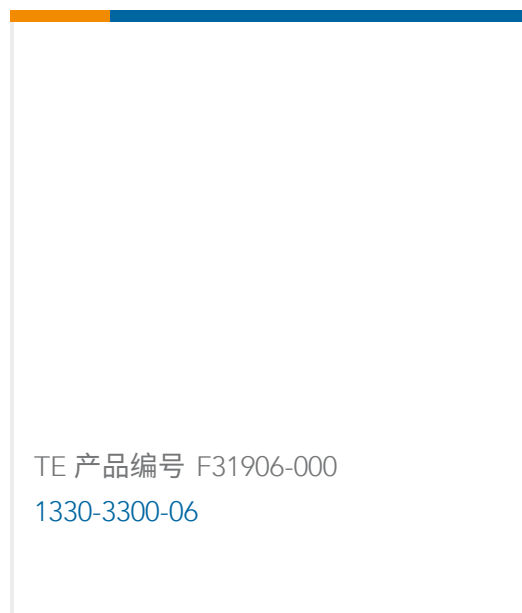
TE 产品编号 F31906-000 1330-3300-06