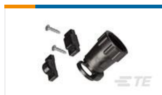
TE 产品编号 206966-7 CABLE SHELL CLAMP SIZE 13