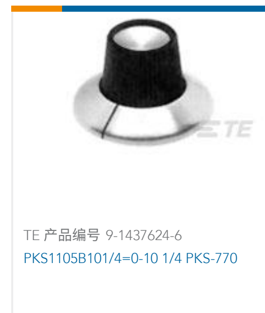
TE 产品编号 9-1437624-6 PKS1105B101/4=0-10 1/4 PKS-770