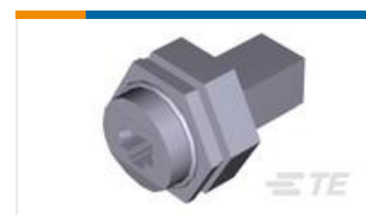
TE 产品编号 1546413-3 ETHERNET RJ-45 BLKHD PASSTHRU