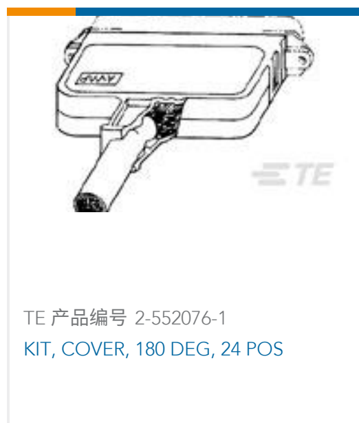
TE 产品编号 2-552076-1 KIT, COVER, 180 DEG, 24 POS