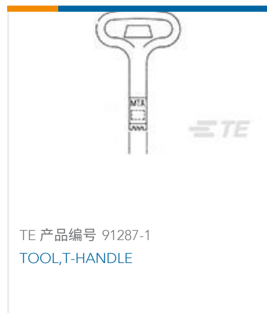
TE 产品编号 91287-1 TOOL,T-HANDLE