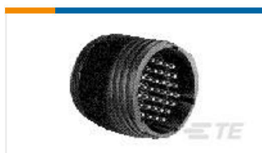
TE 产品编号 206705-2 CPC 13-9 FREE HANGING RECPT