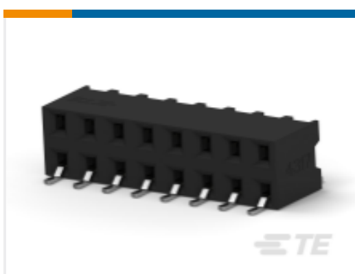
TE 产品编号1-2307729-6 16P,2MM,B-B,REC,DRHZ,SMD,0.1AU, TR