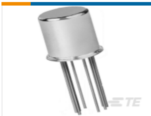
TE 产品编号2-1617108-3 HS-26B = HS RELAY