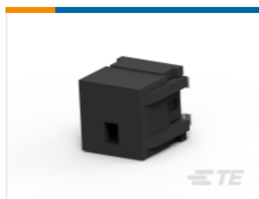
TE 产品编号2331370-1 DET SW4.7X3.8X2.3 GW VERT. NO AG RL