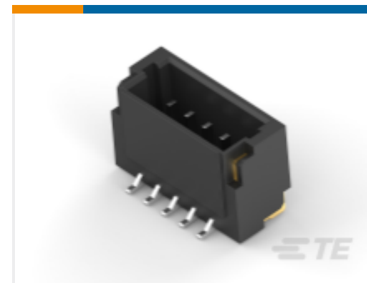
TE 产品编号2367197-5 1.0mm WTB Side Vertical Type With Latch