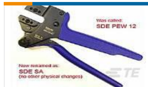
TE 产品编号2031991-1 SDE JPT 12-24AWG ASSY