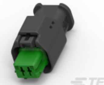
TE 产品编号1823174-5 2POS,1.5MM SFC,REC HSG,ASSY, SEALED