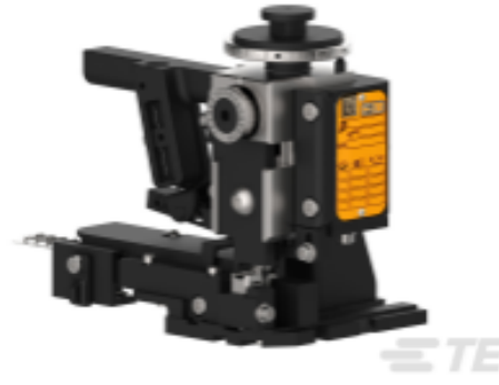
TE 产品编号2266564-1 OCEAN-2.0-APPLICATOR-S-063F118O-RSM