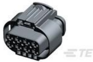
TE 产品编号9-2109441-1 MCP 2.8 8/0P PLUG ASSY NAT/Z