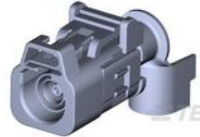
TE 产品编号1438920-5 PLUG KIT, UNASSEM, 1 POS, RG-58 R /A