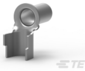
TE 产品编号1438921-2 FERRULE, RIGHT ANGLE, RG-58, SMB