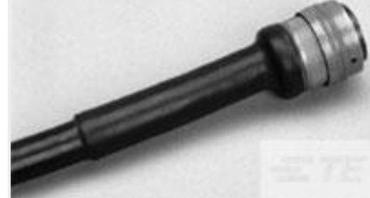
TE 产品编号CV19906001 ATUM-16/4-2-65MM