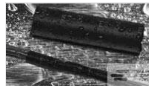
TE 产品编号829131P038 ES2000-NO.1-C1-0-150MM