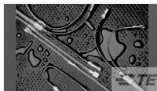
TE 产品编号533141-000 B-106-2502