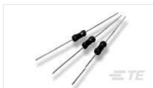
TE 产品编号1-1879354-9 RR03 5% 1R8 AMMO