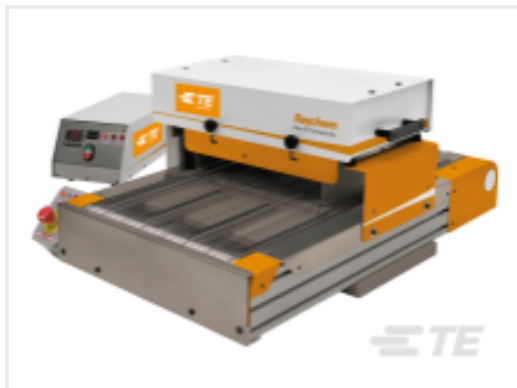
TE 产品编号 2326489-1 MODEL 105 TUNNEL OVEN, 36" ENTRY, STAND