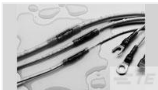
TE 产品编号602549-000 D-406-2008