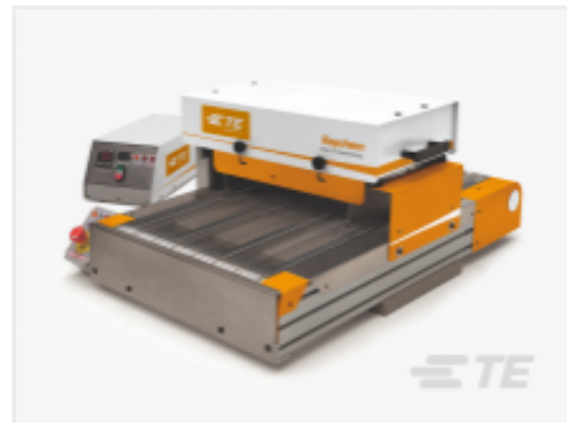
TE 产品编号 955018-000 CLTEQ-M105-TUNNEL-OVEN