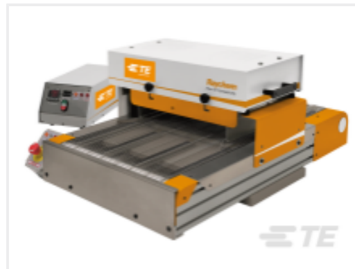
TE 产品编号 2394980-1 MOD 105 TUN OVEN, 69" ENTRY, STANDARD