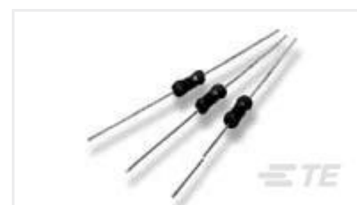
TE 产品编号2-1879354-3 RR03 5% 2R7 AMMO