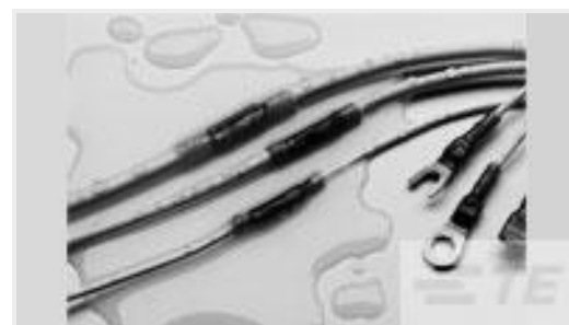
TE 产品编号602707-000 D-406-2009