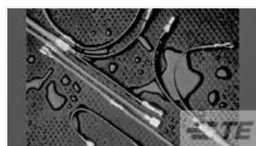
TE 产品编号702145-000 B-106-2503