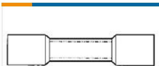
TE 产品编号55845-1 #8 PRE-INSUL SEALED SPLICE