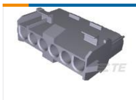
TE 产品编号926307-3 6P UN-MNL AUFN-GEH