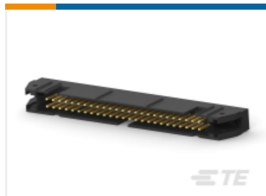
TE 产品编号5499923-9 AMP 锁门通用插头