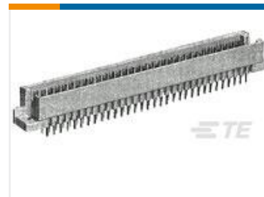
TE 产品编号5650933-5 ASSY,PIN,EUROCARD,TYPE R,LEAD-