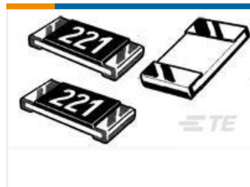
TE 产品编号9-2176070-1 3521 56K 1% 2W