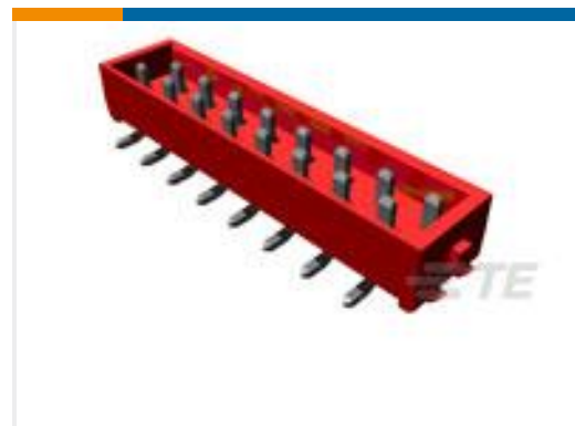
TE 产品编号1-338728-0 MICROM. MOB SMD CON