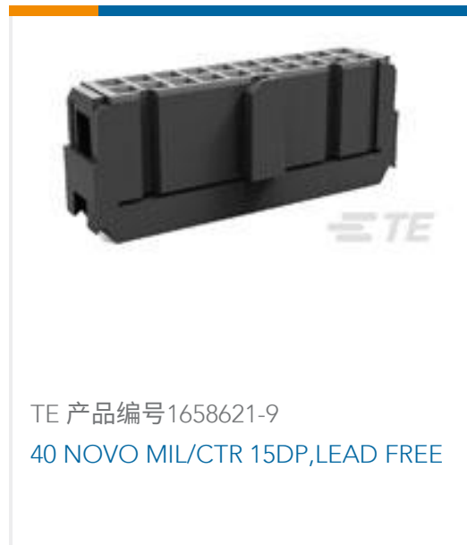
TE 产品编号1658621-9 40 NOVO MIL/CTR 15DP, LEAD FREE