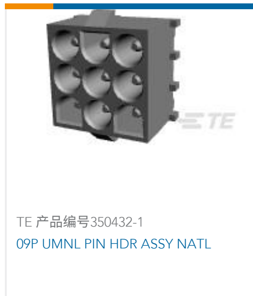
TE 产品编号350432-1 09P UMNL PIN HDR ASSY NATL