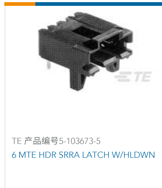
TE 产品编号5-103673-5 6 MTE HDR SRRA LATCH W/HLDWN