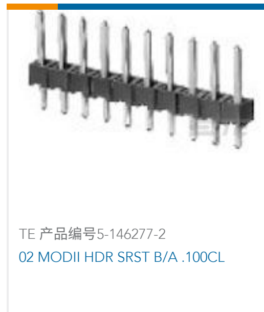
TE 产品编号5-146277-2 02 MODII HDR SRST B/A .100CL