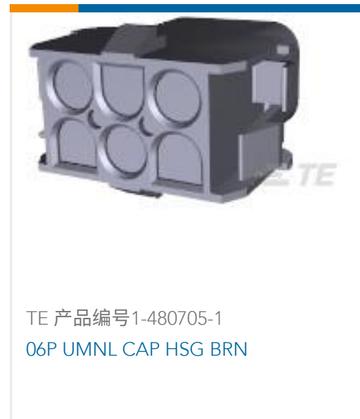
TE 产品编号1-480705-1 06P UMNL CAP HSG BRN