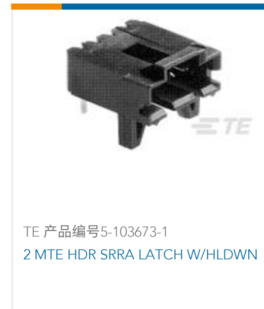
TE 产品编号5-103673-1 2 MTE HDR SRRA LATCH W/HLDWN