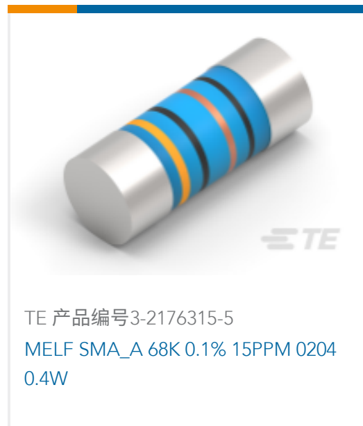
TE 产品编号3-2176315-5 MELF SMA_A 68K 0.1% 15PPM 0204 0.4W