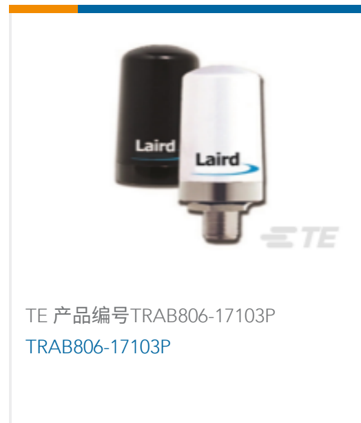
TE 产品编号TRAB806-17103P TRAB806-17103P