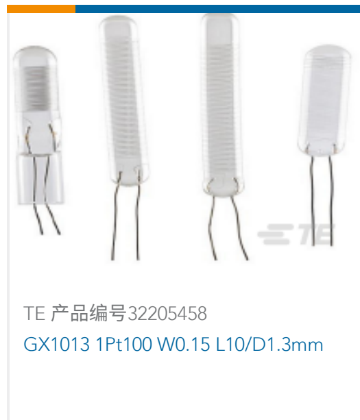
TE 产品编号32205458 GX1013 1Pt100 W0.15 L10/D1.3mm