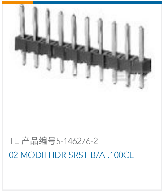
TE 产品编号5-146276-2 02 MODII HDR SRST B/A .100CL