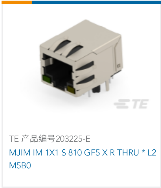
TE 产品编号203225-E MJIM IM 1X1 S 810 GF5 X R THRU * L2 M5B0