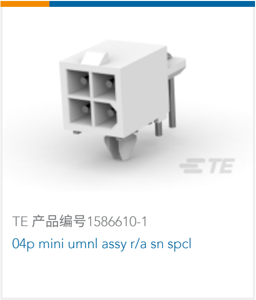
TE 产品编号1586610-1 04p mini umnl assy r/a sn spcl