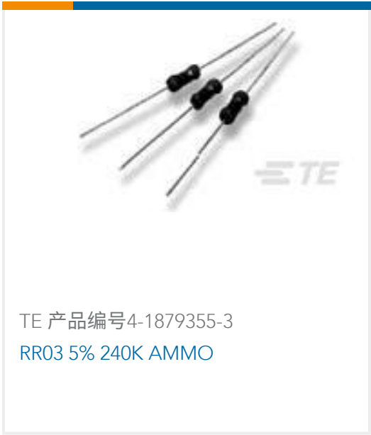
TE 产品编号4-1879355-3 RR03 5% 240K AMMO