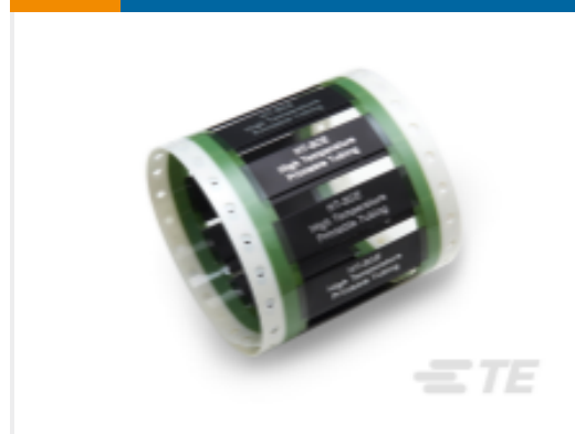
TE 产品编号8306110001 HT-SCE High Temperature Sleeves