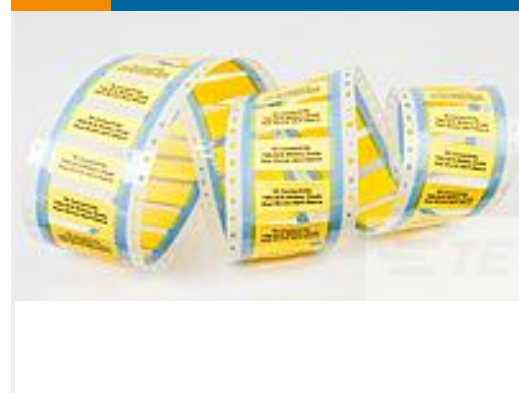
TE 产品编号6632750001 TMS-SCE-3/32-2.0-9