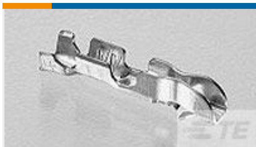
TE 产品编号170205-3 EIS CONTACT LP