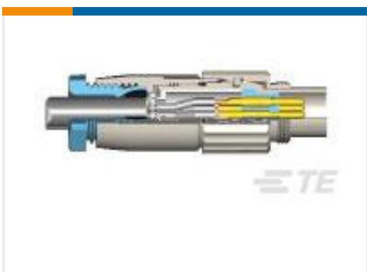
TE 产品编号1-1437719-1 T01-0540-P03-MALE PLUG CONNECTOR-CRIMP