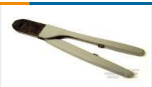
TE 产品编号91562-1 CCII EI SERIES 30-26 ASSY