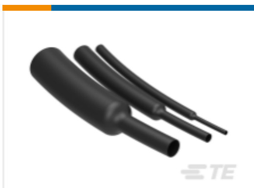
TE 产品编号5068154005 CGPT 2:1 热缩管