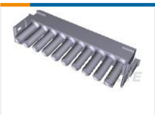
TE 产品编号926302-3 10P UN-MNL STECKGEH