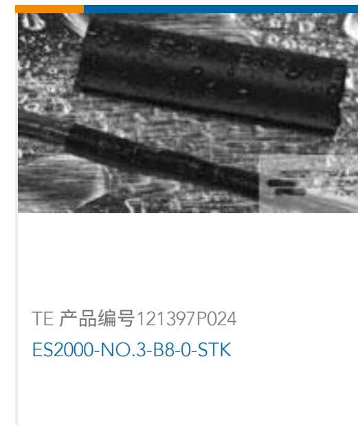
TE 产品编号121397P024 ES2000-NO.3-B8-0-STK