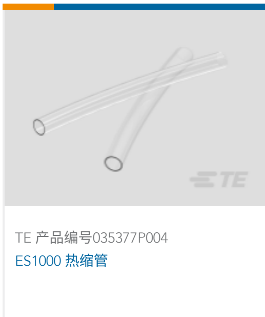
TE 产品编号035377P004 ES1000 热缩管