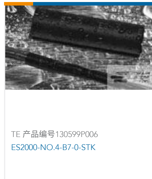
TE 产品编号130599P006 ES2000-NO.4-B7-0-STK