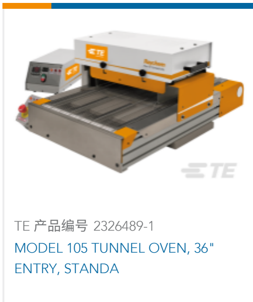
TE 产品编号 2326489-1 MODEL 105 TUNNEL OVEN, 36" ENTRY, STAND