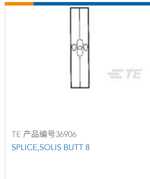
TE 产品编号36906 SPLICE, SOLIS BUTT 8