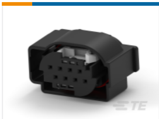
TE 产品编号2134557-2 8POS MQS REC