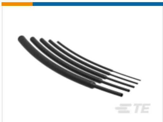
TE 产品编号E05774-000 VERSAFIT-1/4-0-25MM