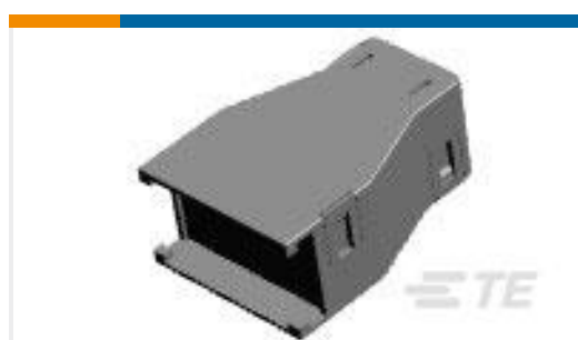
TE 产品编号1986185-1 Strain Relief,6 Posn,D5200 Dynamic. 2