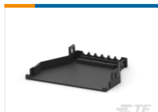
TE 产品编号1776695-1 Strain Relief, D5200, Dynamic AU,TB