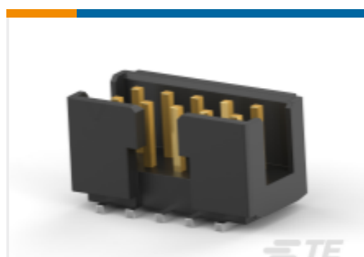
TE 产品编号1-2373376-0 10P,2MM,SHRD HDR,DRVT,SMD,0.1 AU,TB