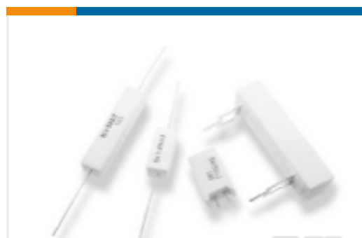
TE 产品编号1623779-5 线绕电阻器：垂直安装