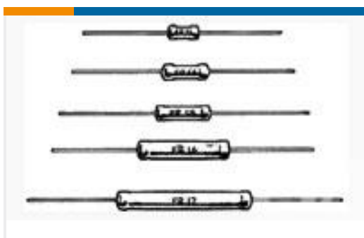
TE 产品编号8-1623746-1 ER74 R22 10% AMMO PK