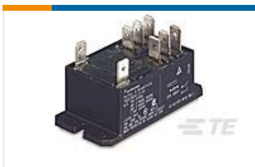
TE 产品编号5-1393211-4 T92P11D22-24