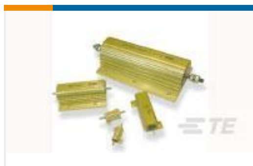
TE 产品编号5-1625984-2 HSA50 390R 5%