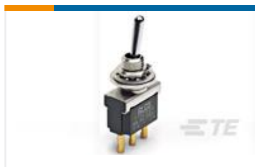
TE 产品编号5-6437630-3 FTD7904=FLAT TOGGLE