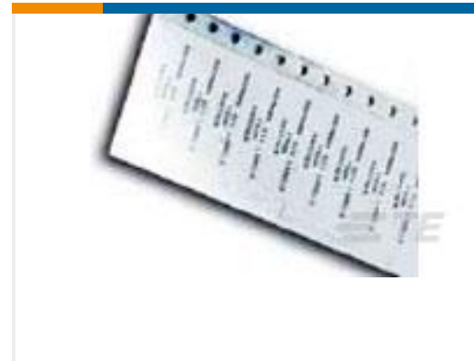
TE 产品编号558147-000 RMK6-WM