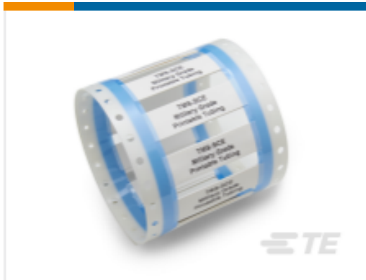
TE 产品编号9422810001 TMS-SCE Military Grade Sleeves