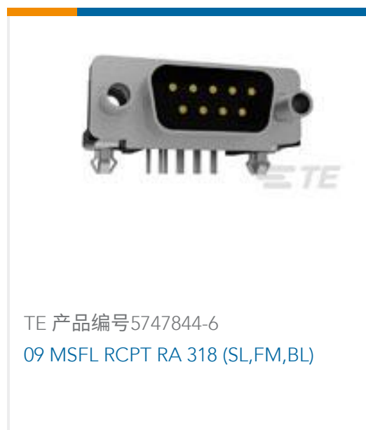
TE 产品编号5747844-6 09 MSFL RCPT RA 318 (SL,FM,BL)