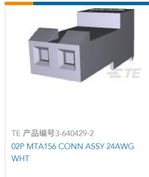
TE 产品编号3-640429-2 02P MTA156 CONN ASSY 24AWG WHT