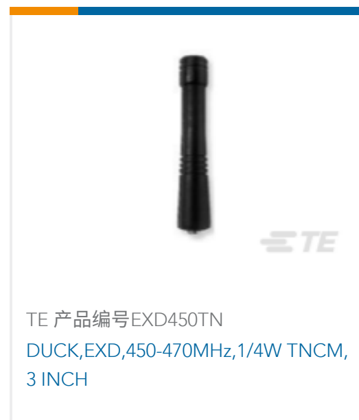
TE 产品编号EXD450TN DUCK,EXD,450-470MHz,1/4W TNCM, 3 INCH