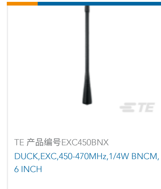
TE 产品编号EXC450BNX DUCK,EXC,450-470MHz,1/4W BNCM, 6 INCH