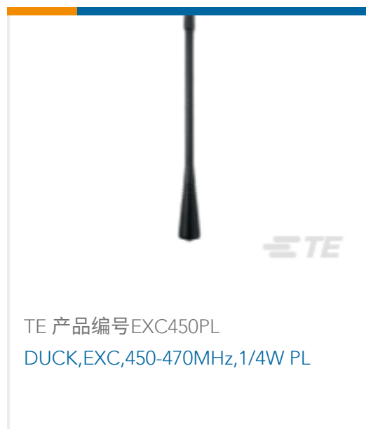
TE 产品编号EXC450PL DUCK,EXC,450-470MHz,1/4W PL