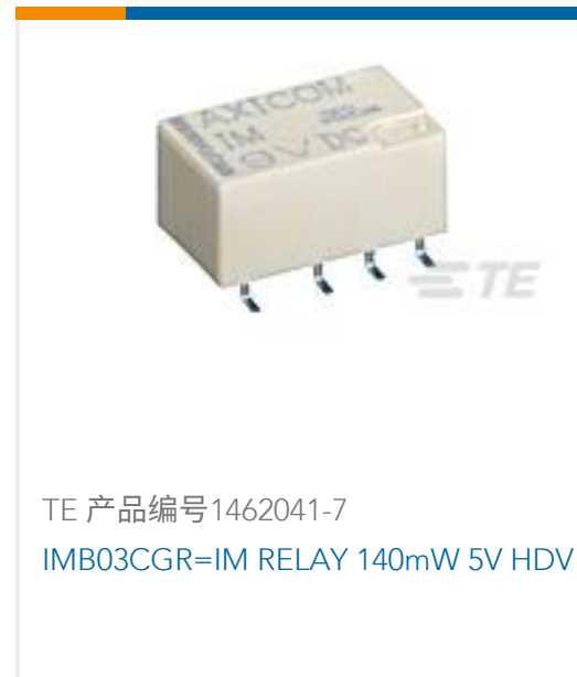
TE 产品编号1462041-7 IMB03CGR=IM RELAY 140mW 5V HDV