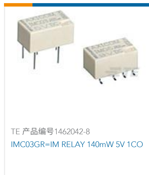
TE 产品编号1462042-8 IMC03GR=IM RELAY 140mW 5V 1CO