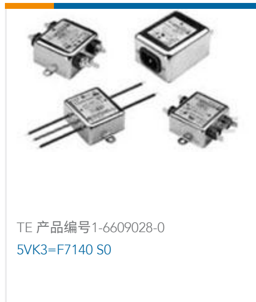
TE 产品编号1-6609028-0 5VK3=F7140 S0