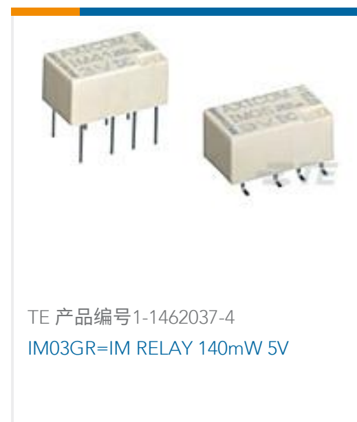
TE 产品编号1-1462037-4 IM03GR=IM RELAY 140mW 5V