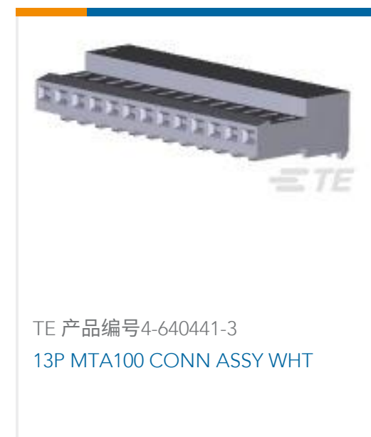
TE 产品编号4-640441-3 13P MTA100 CONN ASSY WHT